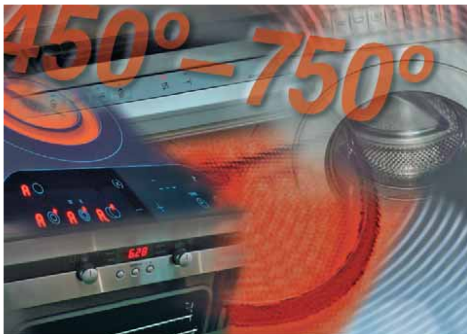
▲ Anwendungen in der »Weißen Ware«

Mit der Wiederentdeckung von »Slow-food« ist ein völlig neues Interesse an der schonenden Zubereitung von Speisen jenseits von Mikrowelle und Heißwasseraufguss-Nährmitteln entstanden. Pt-Temperaturfühler findet man u. a. zur Temperaturregelung von herkömmlichen Kochplatten, im Zentrum der Heizspiralen von Glaskeramik-Platten oder in induktiv arbeitenden Kochplatten. Gelegentlich sind sie sogar schon am Kochtopf zu finden, wo sie per Funk ihre Messwerte an den Regler übermitteln. Hier kommen dann speziell hochohmige Typen zum Einsatz, um den Energiebedarf klein zu halten. Im Backofen spielen Platin-Sensoren die Trumpfkarte mit ihrer großen Mess-