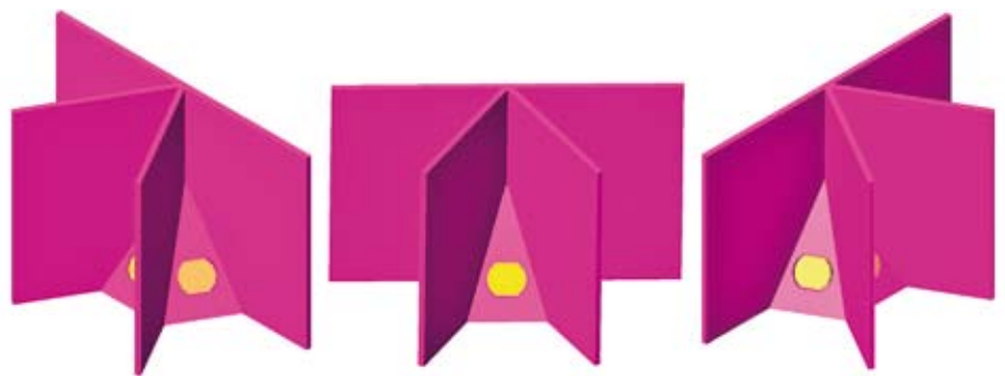
▲ Abb. 1: 3D-Modell des Sonnenscheinsensors

Neben Pyrheliometern existieren einfache Tageslichtmessköpfe für die